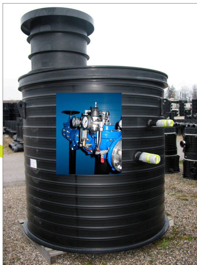
Armaturenschacht z. B. DN 2000 mit Einstieg DN 800 = „DOM“-Lösung