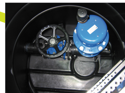
Be- und Entlüftungsschacht